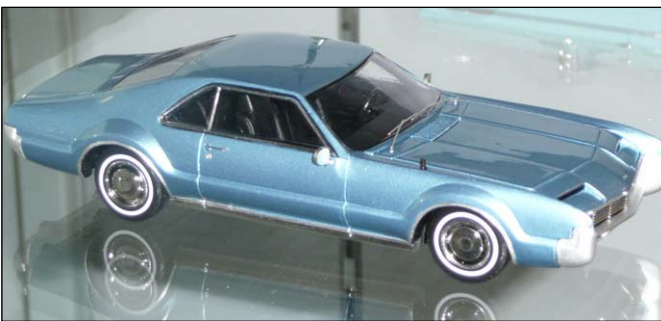
Oldsmobile Toronado von Spark