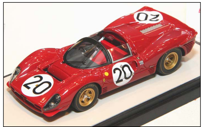
Ferrari P4 von Make Up Eidolon