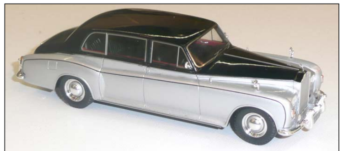
Rolls Royce Phantom VI von True Scale Miniatures