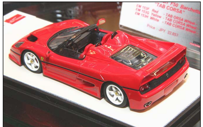
Ferrari F50 von Make Up Eidolon