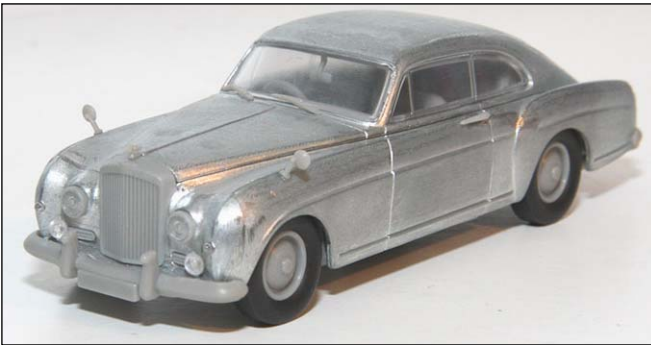
Bentley S1 Continental Prototyp von Oxford Diecast

von diesem Auto gibt es zwar schon Nachbildungen, aber leider keine, die ihm gerecht wird. Hot Wheels Elite hat sich fast ausschließlich Ferrari verschrieben, erfreulich, dass neben reaktivierten IXO-Formen wie Mondial 8, 250 Lusso und 365 GT4 2+2 mit dem 212 Inter Vignale ein wirklich reizvolles Auto angekündigt wird.