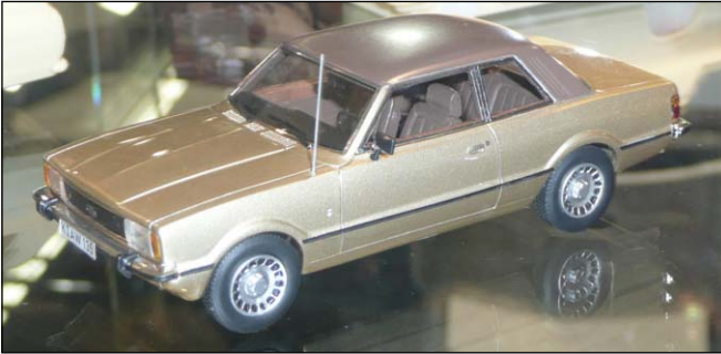
. . . und der Nachfolger vom gleichen Hersteller