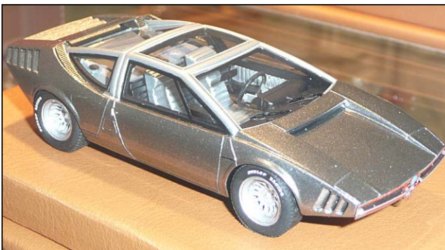
Alfa Romeo Italdesign Iguana von Tecnomodel