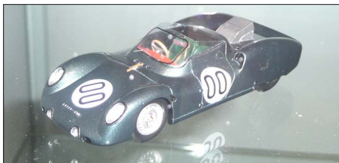
Rover BRM Turbine LM 63 von Bizarre