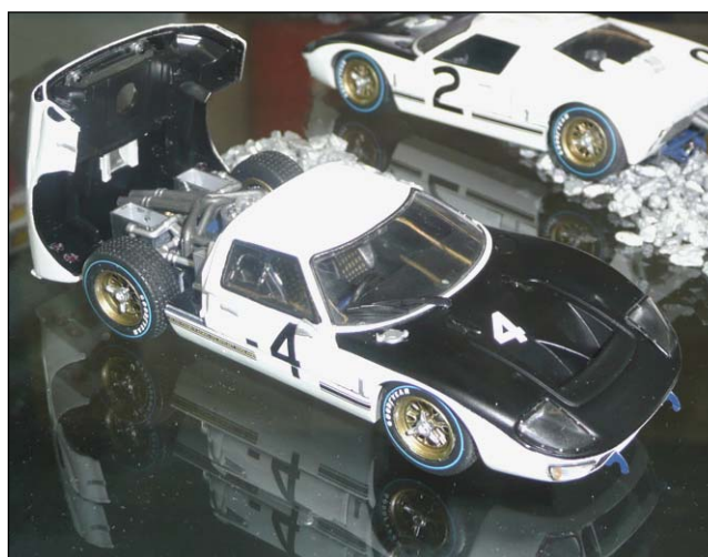
Ford Mk II von Minichamps