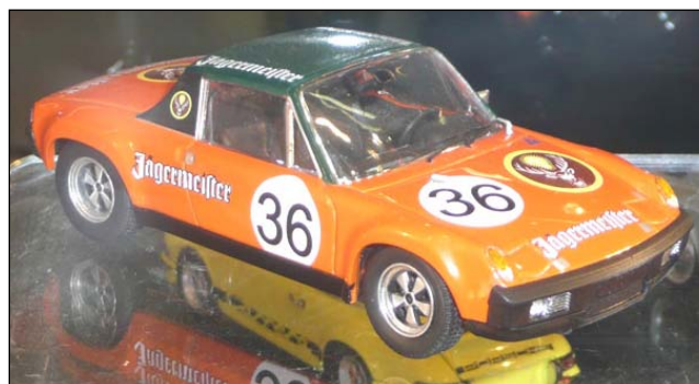
Porsche 914/6 von Schuco