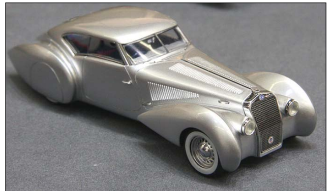
Delage D8 120 Pourtout von Spark