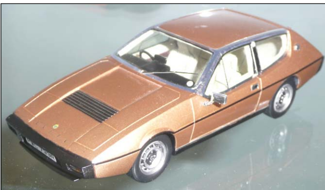
Lotus Elite 74 von Spark