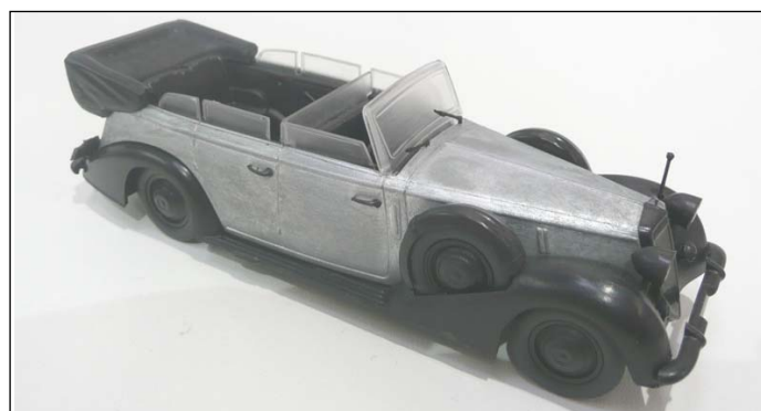
Lancia Astura Ministeriale Prototyp von Starline Models