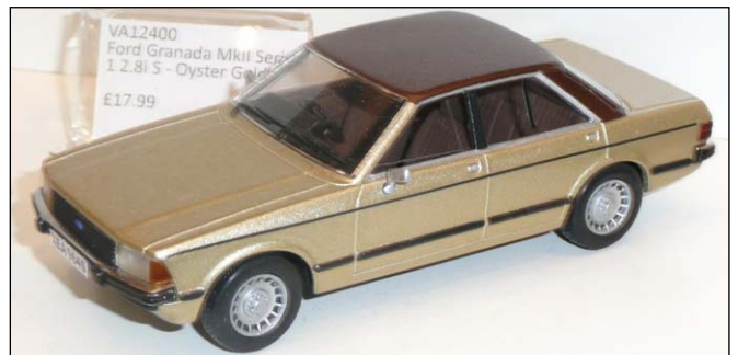
Ford Granada II von Vanguard's