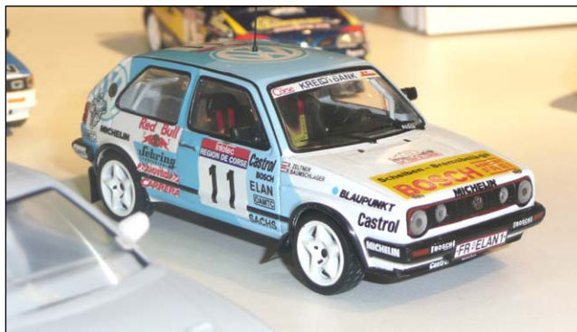
VW Golf GTI 16V Tour de Corse 90 von IXO

Speziell in diesem Kapitel werden Sie nicht jede Version bekannter Fahrzeuge erwähnt finden, sondern nur neue Modelle oder prägnante Varianten. Porsche bleibt immer ein Thema: Schuco geht den nächste Schritt mit 908 Langheck- und Kurzheck-Coupés, zum 914/6 Jägermeister und Sonauto LM 70 kommt noch ein Carrera RSR Martini Targa 73, bleibt zu hoffen, dass man seine Hausaufgaben macht und nicht wieder der Fehlerteufel in den Details steckt. True Scale beginnt eine 917-Serie mit zwei Autos, die in Kyalami 69 und 70 rannten, dazu kommt der 16-Zylinder Can Am-Prototyp. Weiterhin späte 935 aus Amerika und der 966 Spider aus Sebring und von der IMSA 91-93, interessanterweise auch in Jägermeister-Farben. Das 550 Coupé von der Carrera 1953 bringt mit gelb unterlegten Rennnummern etwas Farbe in die Vitrine. Die 718/8 Spider Le Mans 63 kommen bei Spark selbst, ebenso die ganz späten 908, die noch 1976 in der Sarthe dabei waren. Der 917 als Siegerwagen von Zeltweg 69 ist wichtig, das Langheck aus dem gleichen Jahr als Gulf-Präsentationsauto ist so nie im Rennen gefahren und deshalb eher für Hardcore-Porsche-Sammler. Zwei weitere Seiten im Katalog nur