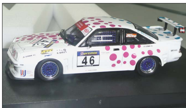
Opel Manta 24h Nürburgring von Minichamps Evolution