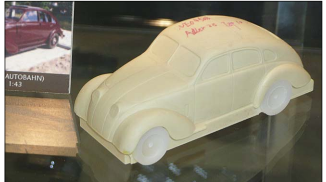
Autobahn-Adler 2,5 Liter, Prototyp von NEO.