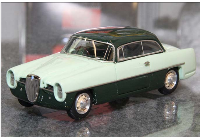
Lancia Aurelia Ghia Prototyp von ABC

Von der im vergangenen Jahr angekündigten preisgünstigeren Modellserie "Vision" ist leider noch nichts zu sehen gewesen. Make Up Eidolon bringt noch 2011 den Ferrari 250 GTO und den Ferrari 250 Testa Rossa und bei der bisherigen Qualität der japanischen Modelle dürften hier wohl echte Meisterwerke kommen, wenn die Modellwahl natürlich nicht gerade von Einfallsreichtum zeugt. . .