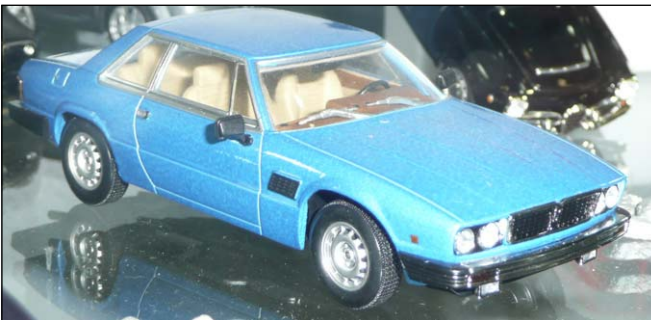
Maserati Kyalami von Minichamps in metallicblau