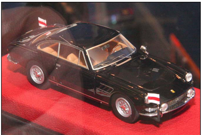
Ferrari 330 GT 2+2 Pace Car Le Mans von BBR