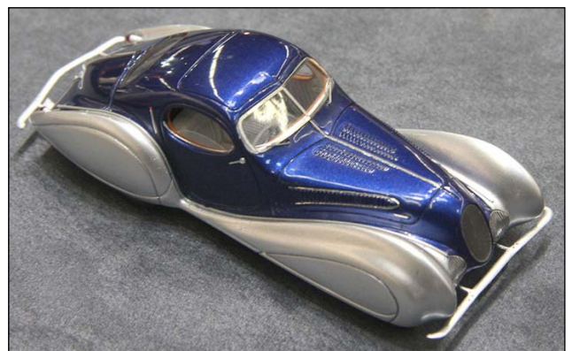
Talbot Lago T150 Figoni & Falaschi von Spark