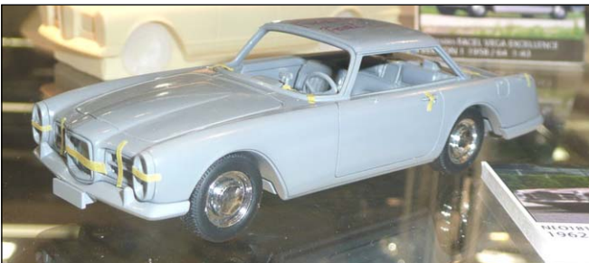
Facel Vega Facel II Prototyp von NEO