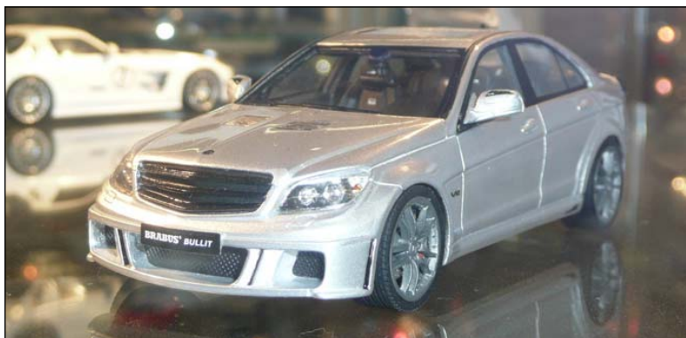
Brabus Bullit, eine C-Klasse mit V12, erstes Modell der Schuco-Resinserie PRO.R43.

Mini Countryman, Mercedes SLK (statt mit Formel1- jetzt mit SLS-Schnauze) und facegeliftete C-Klasse oder die neuen VW Touareg und Passat sind Beispiele, ausgefallene Modelle erscheinen dann in der neu initiierten Resinserie PRO.R43, die allerdings auch mit selbstbewußten Preisen von an die 70 Euro startet. Erwarten können wir den Brabus Bullit, eine C-Klasse mit V12-Triebwerk sowie Audi S5 und RS3 Sportback, ein weiteres Modell des Mercedes SLS GT3 darf auch nicht fehlen. Das moderne Rolls Royce-Programm findet man bei True Scale Miniatures im Vertrieb von Schuco, Phantom Sedan, Coupé und Ghost werden als