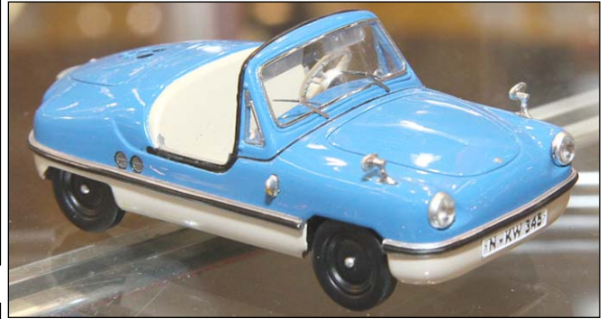
Victoria Spatz von Premium Classixxs Unique

gedulden muss man sich wohl bei den Langversionen der Reihen W123 und W124 von NEO. Wie im Original wird bei der gleichen Marke aus dem Glas 1300 GT ein BMW 1600 GT, ansonsten sehe ich nur noch M535i(E21) und 3,0CSL bei Spark, ebenso Alpina C1 und B7. Bei Porsche haben es sowohl Schuco als auch Minichamps geschafft, ihre Porsche 914/6-Modelle fertigzustellen, mal sehen, wer in Erscheinungstermin und Qualität die Nase vorne hat. Ansonsten wieder nur 11er-Varianten und der Porsche 928S bei Spark. Folgerichtig sahen wir bei NEO den Prototypen der Borgward 2400 Pullman-Limousine, ein interessantes Modell! Für den Kleinwagenfreund erfreulich, dass der Victoria Spatz von Premium Classixxs serienreif ist, allerdings kostet der Kleine rund 70 Euro, da er zur Unique-Serie gehört.