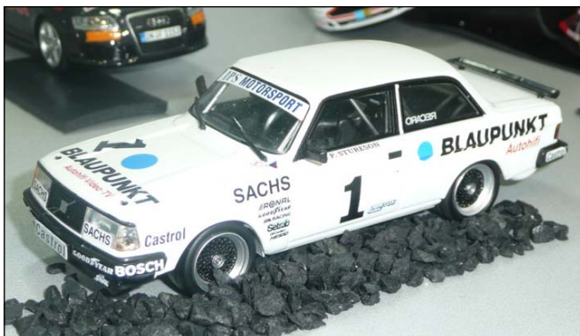
Volvo 240 Turbo DTM 1985 von Minichamps