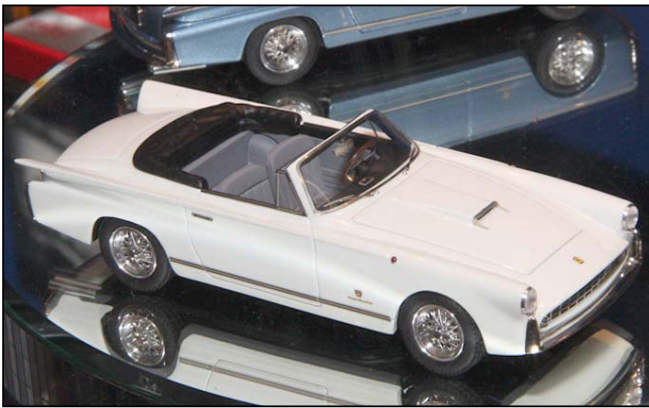
Ferrari 410 SA Cabrio Boano von BBR