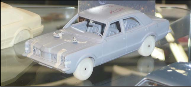
Ford Taunus 1970 Prototyp von NEO. . .