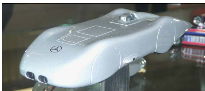
Mercedes W125 Rekordwagen von Minichamps

Passagiere nach, findet aber im Moment hauptsächlich Leute, die political uncorrect sind. Große Freude bei Spark, wo die ersten Muster der letztes Jahr avisierten Serie französischer Blechwolken zu sehen waren. Die im normalen Spark-Preisbereich angesiedelten Miniaturen sind sehr überzeugend und lassen Appetit auf weitere Projekte aufkommen. Zusätzlich zu den letztjährig Ankündigungen findet man im Katalog noch einen Bugatti Galibier von 1939, einen Delage D8 120 von Letourneur & Marchand, einen Talbot Lago T150C Roadster Fioni & Falaschi, den Delahaye 175 Roadster Saoutchik 1949 sowie den Talbot Lago T150SS, der 1938 in Le Mans den 3. Platz errang. Als Kuriosum findet man im Katalog auch einen Morgan Threewheeler von 1935! Minichamps lässt uns noch auf den Bentley Embiricos und den Alfa Romeo 8c2900 MM38 warten, dafür durften wir bereits ein Handmodell des Mercedes W125 Rekordwagen von 1938 bewundern, ein wunderschönes Stromlinienfahrzeug.