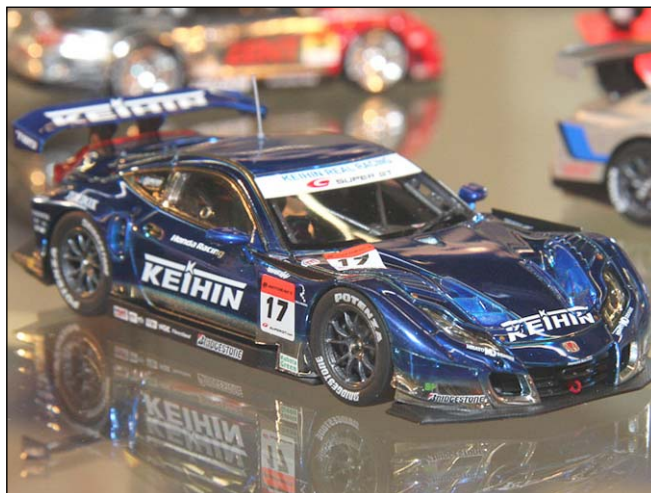
Honda von der japanischen GT-Meisterschaft von Ebbro

Neben vielen Varianten und einigen lang erwarteten Modellen gibt es auch einige Neuheiten: Spark will den Penske-Camaro jetzt auch in der 69er Bauserie produzieren, vom BMW 3.0 Coupé dürfen wir weitere tolle Versionen erwarten und der soeben erschienene Jaguar XJ12 C bleibt auch nicht alleine. Schön auch der Shelby Mustang von LM67. Der 54er Buick Century von der Carrera Panamericana bei True Scale erfreut das Herz, und dass Minichamps mit Rover Vitesse und Volvo 242 turbo aus der DTM 85 und 86 Fortschritte macht, ist höchst positiv zu vermerken.