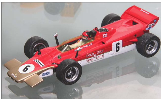
Lotus 56 Formel 1 1971 von Spark

Den Kuchen für neue Formel 1-Modelle teilen sich jetzt Minichamps, wo Sebastian Vettels Siegerauto sehnhchst erwartet wird, Hot Wheels Elite (Ferrari), Norev (Renault, auch bei MC) und Spark, die die Renner der kleinen Teams produzieren. Der Markt für ältere Fahrzeuge scheint groß genug, Spark kündigt massenhaft Neuheiten an Auf fast 7(!) Katalogseiten sieht man von Alfa Romeo über BRM, Ligier, Lotus, RAM, Tyrrell, Modena oder Shadow unzählige Monoposti, ein Fall für Spezialisten! Für True Scale entstehen Porsche 718 und 804, für Biante der Cooper Climax von 1959. Und bei Ebbro bekommt man inzwischen fast jeden Honda F1 aus den 60ern. Erwähnenswert noch die eleganten Essex-Lotus 81 und 88 von Minichamps .