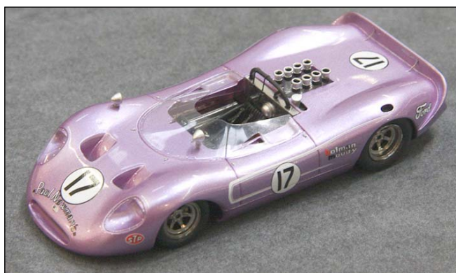
Honker Can Am 1967 von Spark

Auch dieses Jahr gibt es hauptsächlich Spark-Modelle auf diesem Sektor: Honker und Porsche 917/69 sind fertig, der Rest der Ankündigungen wie BRM P154 und Porsche 917/10 STP wird folgen, dazu kommen noch March 707, Shadow Mk II und Lola T310. Für True Scale fertigt man Chaparral 2D, 2E, 2F und 2G, die teilweise (2D und 2E) erst in der teuren Signature Series als Doppelset angekündigt sind, ich hoffe besonders bei den Can Am-Rennern auf Einzelmodelle!