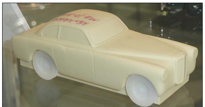
MG TD Arnolt Prototyp von NEO