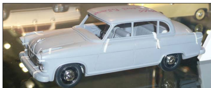
Borgward 2400 Pullman Prototyp von NEO