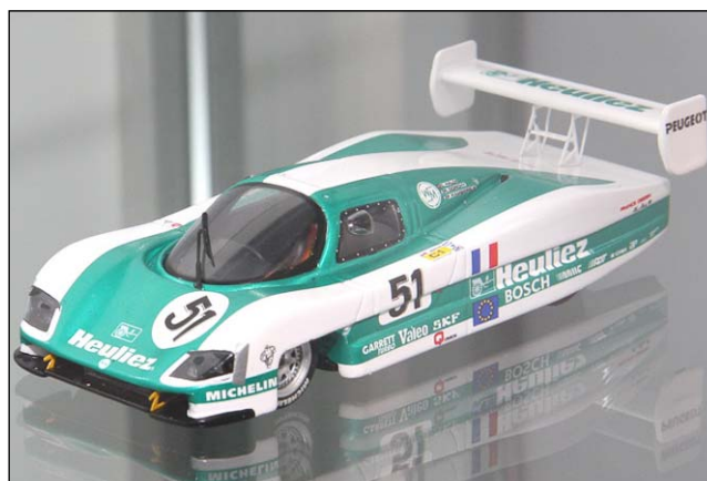
WM Le Mans 88 von Bizarre