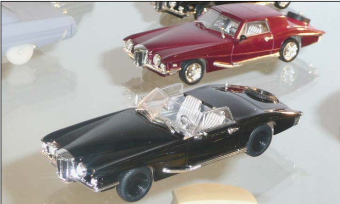
Stutz Blackhawk von Premium X