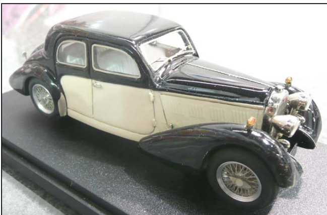
Bugatti 57 Graber von ABC

Handel. Neu bei Make Up Eidolon ist der hochdetaillierte Ferrari F50 mit kompletter Motornachbildung und einem sehr aufwändigen Innenraum. Ebenfalls noch aktuell ist der Ferrari 330 P4 (den es auch als 412 P gibt).