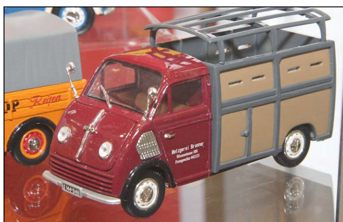
DKW 3=6 Viehtransporter von Premium Classixxs

Ganz kurz: Keine echten Neuheiten bei Minichamps, aber ein wunderschöner Ford F3500 Getränkehalter Coca Cola; Barkas B1000 Pritsche und VW LT Rothmans Porsche bei Schuco, DKW Schnellaster mit zu öffnender Motorhaube, unter anderem als Viehtransporter schon fertig, Puch Haflinger(!!!) und diverse Tatra T138 LKW als Ankündigung; IXO LKW-Serie noch nicht in Sicht, laut M. Perez fehlt das Interesse des Handels. Wen wundert's, wenn die Sachen zuerst im französischen Kiosk landen. Dort gehen sie aber scheinbar wie das warme Baguette weg. Auf dem Stand waren auch Nutzfahrzeuge aus dem Osten zu sehen, ein Robur Garant Bus, Tatra Kipper oder IFA S4000 Pritsche, allerdings ohne aktuelle Perspektive.