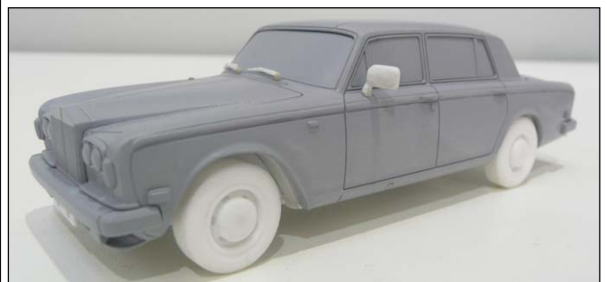
Rolls Royce Silver Shadow Prototyp von Starline Models

Italien ist dieses Jahr eher unterrepräsentiert: Minichamps muss seine Rückstände (Alfasud Sprint, Maserati Kyalami, Lambo-Serie) aufarbeiten, Auto Art hat gerade den phänomenalen Miura ausgeliefert, dem ein noch aufwendigerer Countach folgen soll (wir wünschen uns mehr Mut bei der Vorbildauswahl!), Brumm macht aus seinem Fiat 500 zwei Giannini-Versionen, den 500TV und den 590GT Vallelunga, Norev bereitet Kioskmodelle wie Fiat 1400 Cabrio oder Lancia Flavia Zagato neu auf, und Rio stellt dem Fiat Nuova 1100 eine hübsche TV-Version zur Seite. Selbst NEO hat auf der Messe keine neuen Italiener gezeigt. Bleibt noch das Abarth OT2000 Coupé America von Spark, ein Wunschmodell, wenn es nicht letztes Jahr in der Kioskserie enthalten gewesen wäre. Aber vielleicht ist es ja um so viel besser, dass der Abarth-Fan schwach wird! Und der Lancia Aurelia B24 Spider vom gleichen Hersteller könnte natürlich ein Traum werden;