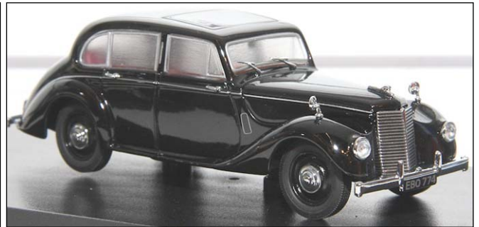
Armstrong Siddeley Lancaster von Oxford Diecast

Nachbildungen englischer Autos aus der Blütezeit der dortigen Automobilindustrie stehen hoch im Kurs, und die Modellauswahl von Oxford Diecast ist auch dieses Jahr interessant. Dem bereits angekündigten Sunbeam Talbot 90 (auch in einer Rallyeversion, Monte 52 2. Platz mit Stirling Moss!) folgen bald Armstrong Siddeley Lancaster und Hurricane sowie der Bentley S1 Continental. Und dann erzählte man uns vom nächsten Projekt, einem Jaguar XK150, gute Idee! Die Auslieferung verzögert sich etwas, da aufgrund der großen Nachfrage alte Modelle nachproduziert werden müssen, vor allem der SS Jaguar und der Austin Princess haben riesigen Erfolg. Bei Starline Models erfüllt sich Roland Ender den Wunsch nach einem preiswerten, aber guten RR Silver Shadow und Corniche, natürlich sind später auch Bentleys möglich. Überhaupt müssen die Liebhaber dieser