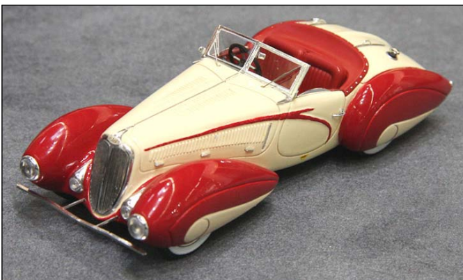
Delahaye 135 Figoni & Falaschi von Spark