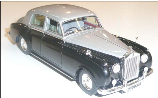
Rolls Royce Silver Cloud I von True Scale Miniatures