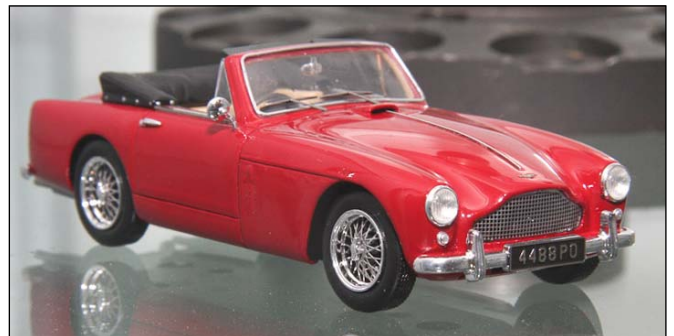
Aston Martin DB2/4 Convertible von Spark