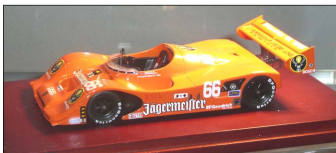
Porsche 966 IMSA 1991 von True Scale Miniatures