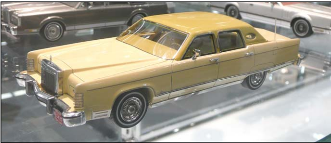
Lincoln Continental Town Car von NEO Scale Models